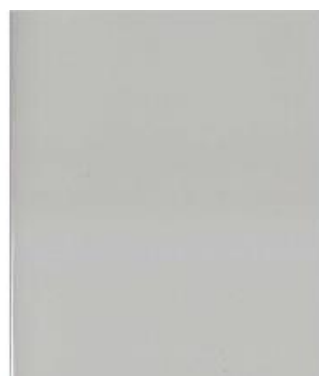
Achatgrau - RAL 7038 7038.05