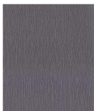
Basaltgrau - RAL 7012 7012.05