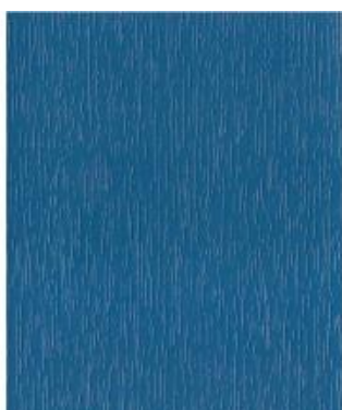
Brillantblau - RAL 5007 5007.05