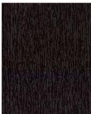
Braun Dekor 8518.05