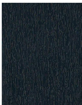
Anthrazitgrau - RAL 7016 436-5003