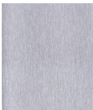
Aluminium gebürstet 436-1001