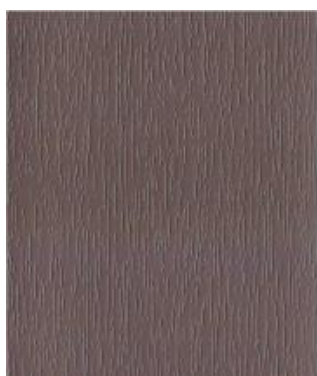
Quarzgrau - RAL 7039 1.7039.05