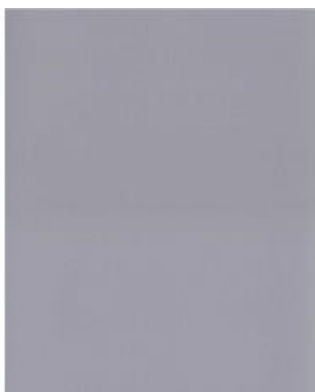
Silbergrau - RAL 7001 7155.05