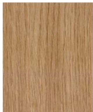
Eiche natur 3.1670.11