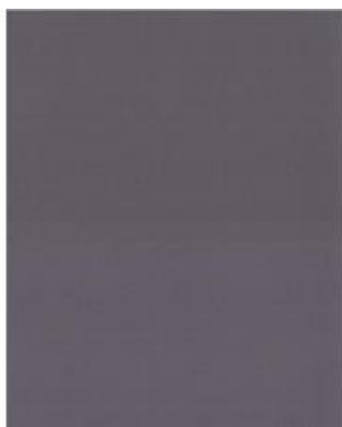
Basaltgrau - RAL 7012 7012.05