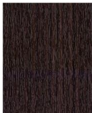
Eiche dunkel 3.1670.04