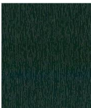
Moosgrün - RAL 6005 6005.05