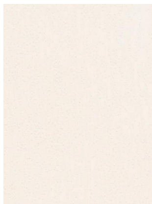
Cremeweis-Kreme - RAL 9007 1.37905 167