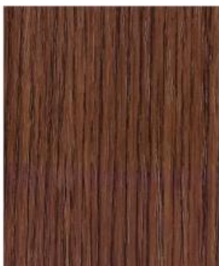
Eiche hell 3.1670.02