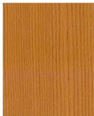
Oregon 4 1.1920.01