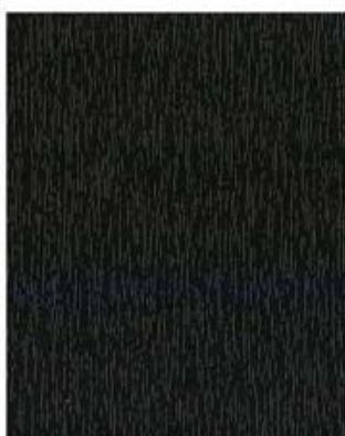
Tannengrün - RAL 6009 F 436-5021