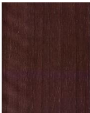
Siena Noce 49237