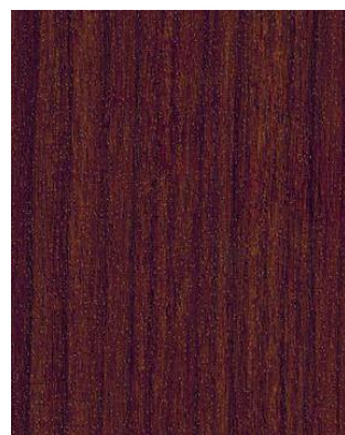
Macore 9.3162 002-116700