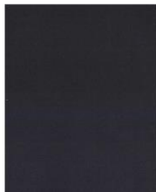
Anthrazitgrau - RAL 7016 436-7003