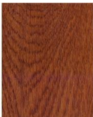
Golden Oak 49158