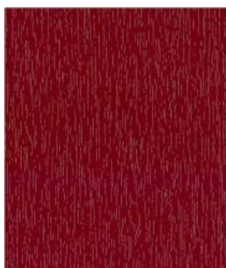
Rot - RAL 3011 3081.05