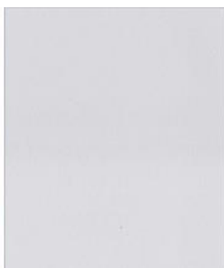
Lichtgrau - RAL 7035 7251.05