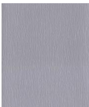
Silbergrau - RAL 7001 7155.05