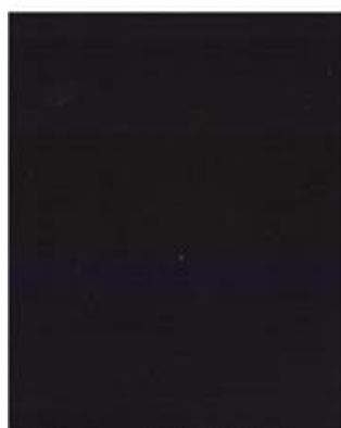
Schwarzgrau - RAL 7021 7021.05