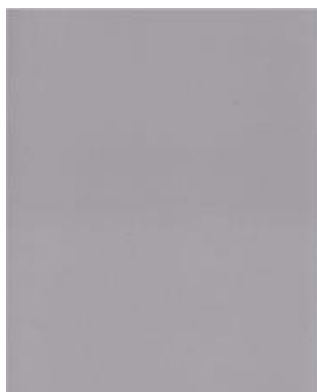
Signalgrau - RAL 7004 7004.05