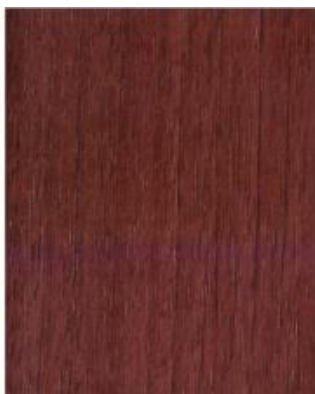
Siena Rosso 49233