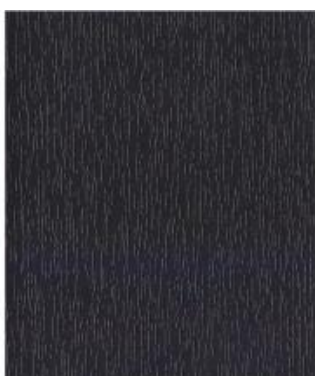
Anthrazitgrau - RAL 7016 436-5003