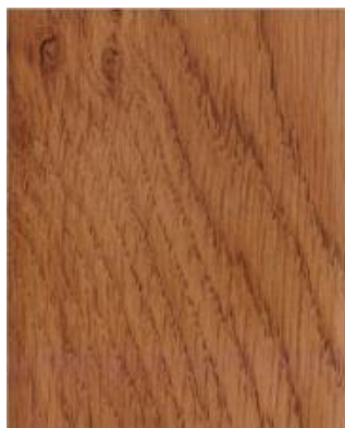
Winchester XA 49240

PLEASE NOTE: The presented colours are for illustrative purposes only and may significantly differ from the actual window colour.